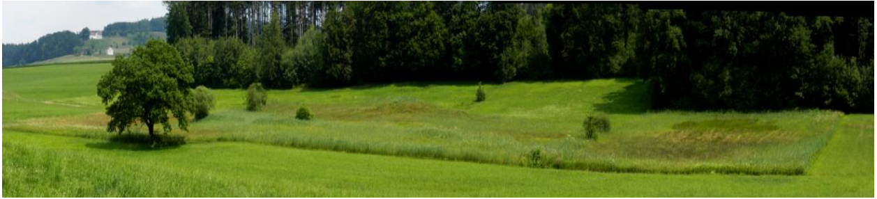
Senke im Osten (Kanton St. Gallen).