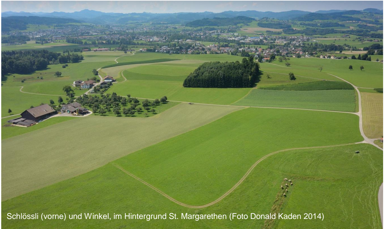
Schlössli (vorne) und Winkel, im Hintergrund St. Margarethen