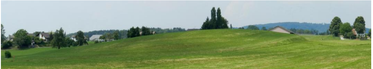
Räbbüel von Süden (Bäume stehen hinter der Kuppe).