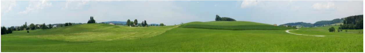
Blick von Süden. Rechts von der Bildmitte Chilchbüel. In der linken Bildhälfte: Räbbüel.