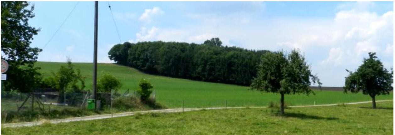
(Z.T. bewaldete) Ostflanke Chilchbüel von Osten.