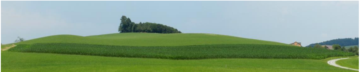
Chilchbüel mit Feldgehölz von Süden.