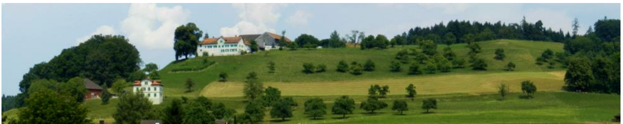
Schloss Bettwiesen (Hintergrund) und dessen Ostbereich von Süden (Räbe) aus.