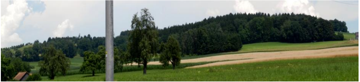
Ostbereich des Gebietes (Hinter Obstgarten im Vordergrund) von Süden aus.