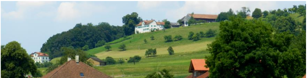
Schloss Bettwiesen. Blick von Süden.