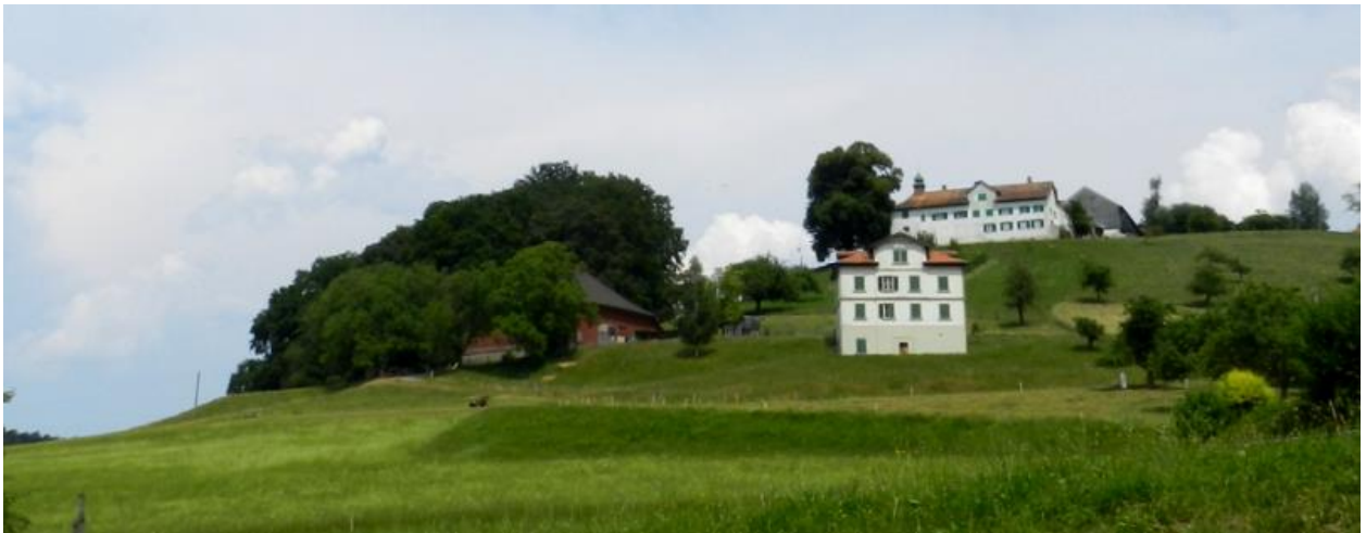
Schloss Bettwiesen (Hintergrund) und Westbereich von Südwesten (Kirche) aus.