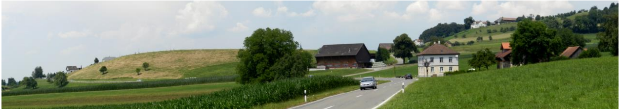
Ansicht von Süden. Links die markante Kuppe ‚Räbe‘. Rechts am Horizont das Schloss Bettwiesen.