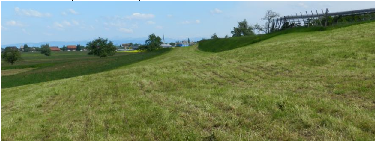
Südliche Geländekante (Steinrieseln).