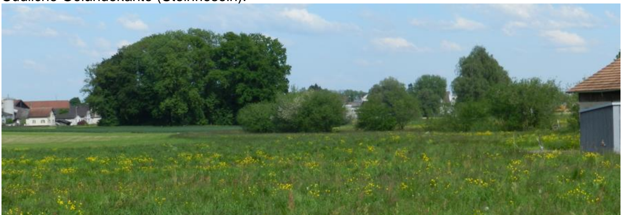
Östlich Engishofen Richtung Oberaach.