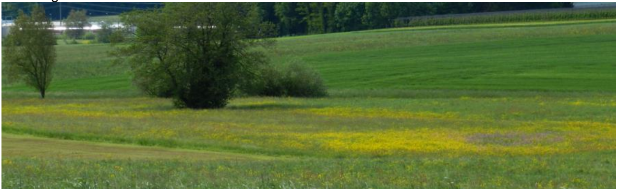
Feuchtere Wiese (südlich Äntemos).