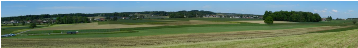
Ostteil von Südwesten (Steinrieseln) fotografiert.