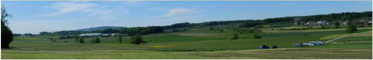
Westteil von Südosten (Steinrieseln) fotografiert. Einzel-Büsche: Begleitvegetation der Ach. Im Hintergrund Ennetaach (Stadler).