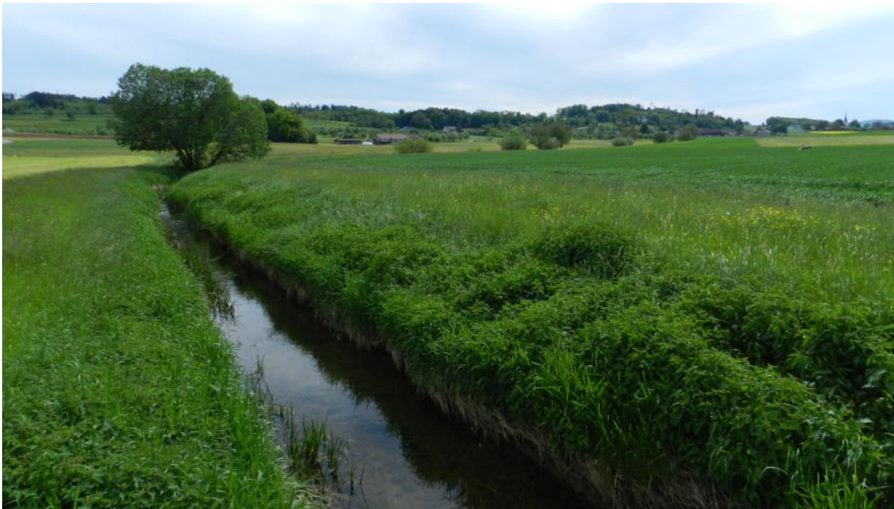
Ach Richtung Südwesten.