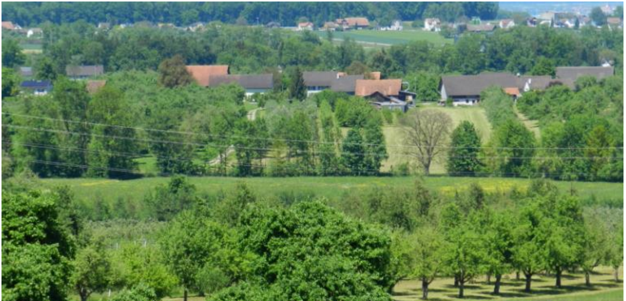
Blick von Obrishause über Gehölz des Wilerbach nach Langgrüt.