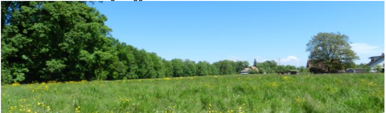
Südlich Aach Richtung Osten (Fälmoos).