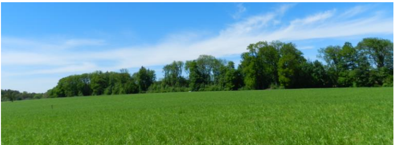
Südlich Wilerbach Richtung Westen.