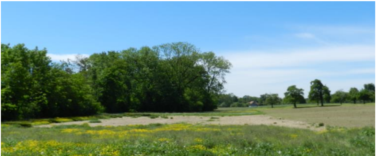
Nördlich Wilerbach Richtung Westen (Under-Burüti im Hintergrund)