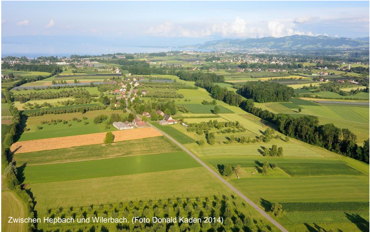
Zwischen Hepbach und Wilerbach.