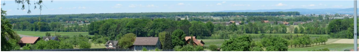
Blick von Süden (Obrishausen nach Nord-Westen).