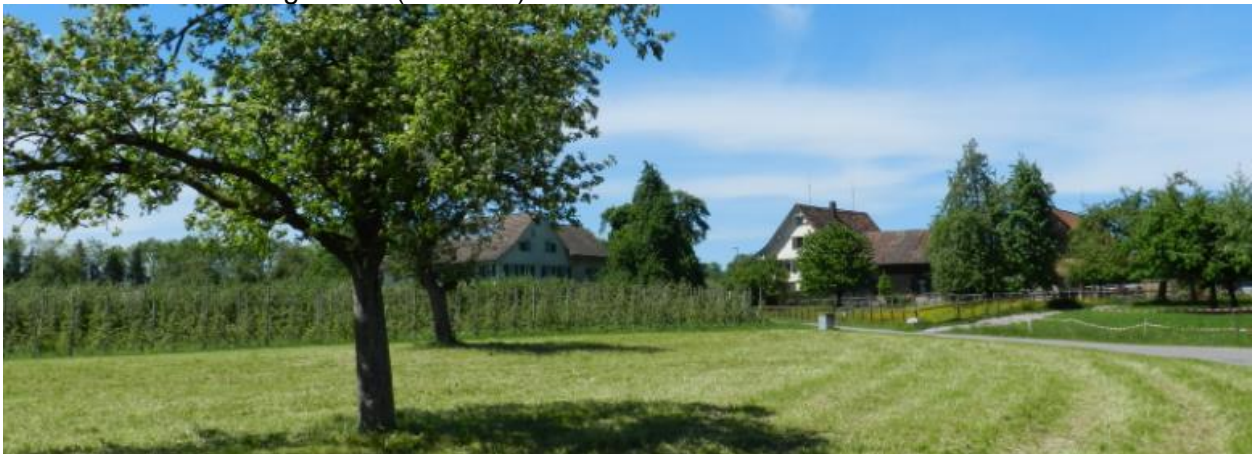
Oberhüsere von Süden.