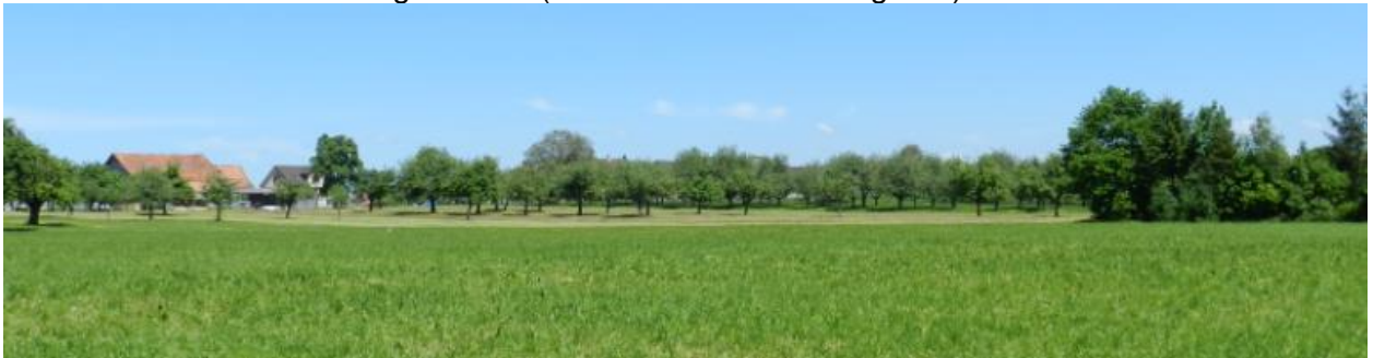
Nördlich Wilerbach Richtung Langgrüt.