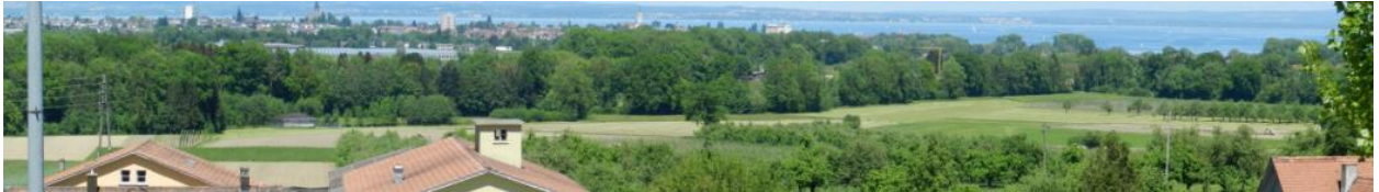
Blick von Süden (Obrishausen nach Nord-Osten).