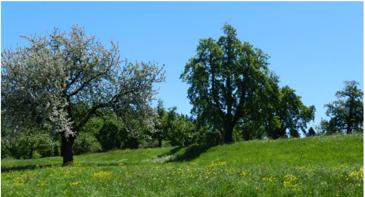
Obstbaumwiesen mit Ackerterrasse südlich Rüüti (Sonebärg).