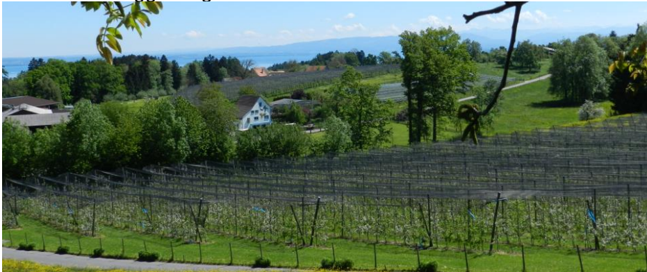
Vom Aussichtspunkt Ruggisberg nach Nordosten (Lenggehof).