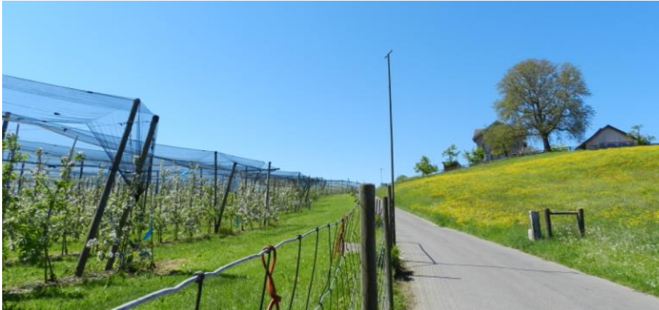
Auffahrt zu Ruggisberg.