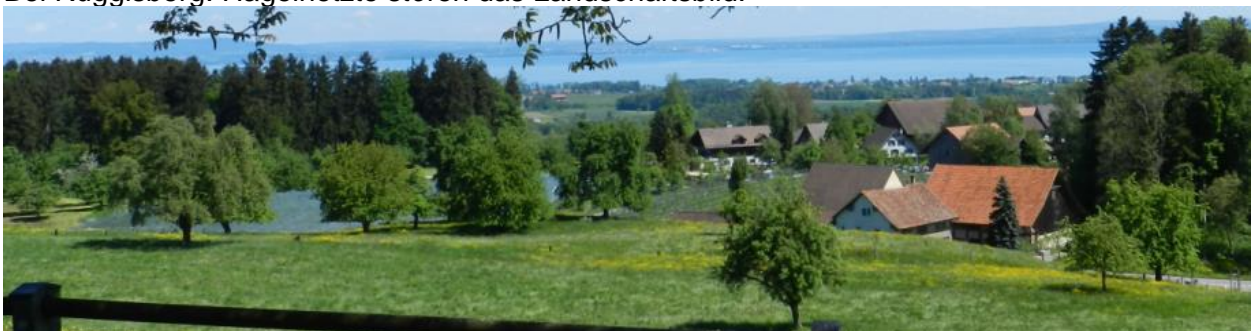
Vom Aussichtspunkt Ruggisberg nach Norden (Watt).