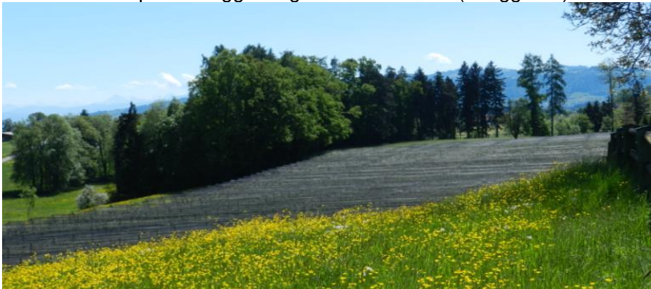
Bei Ruggisberg: Hagelnetzte stören das Landschaftsbild.