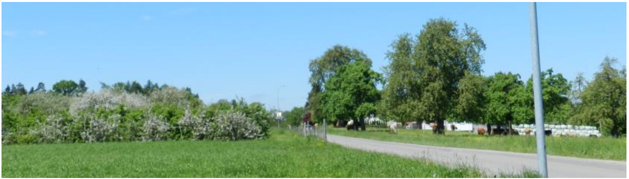
Südöstlicher Teil. Fotografiert von Osten gegen Groosagger (rechts), Königshalde (links).