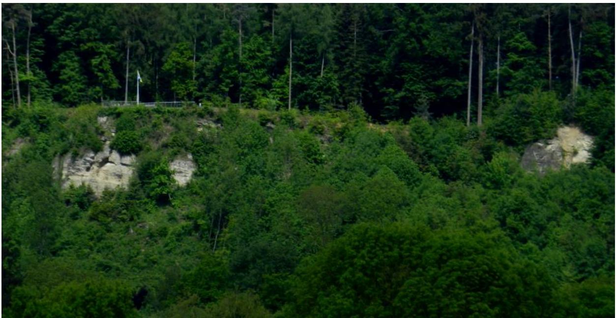
Felswände an der Felsenholz Nordseite.