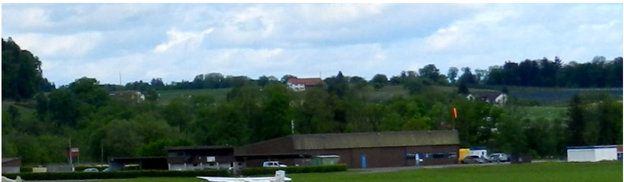
Nach Osten orientierter Anstieg hinter Gebäuden des Flugplatzes Sitterdorf und Bachgehölzen zu Andmoser-Hochebene mit Tannenhof links, Feldhof Mitte und Wiisler rechts.