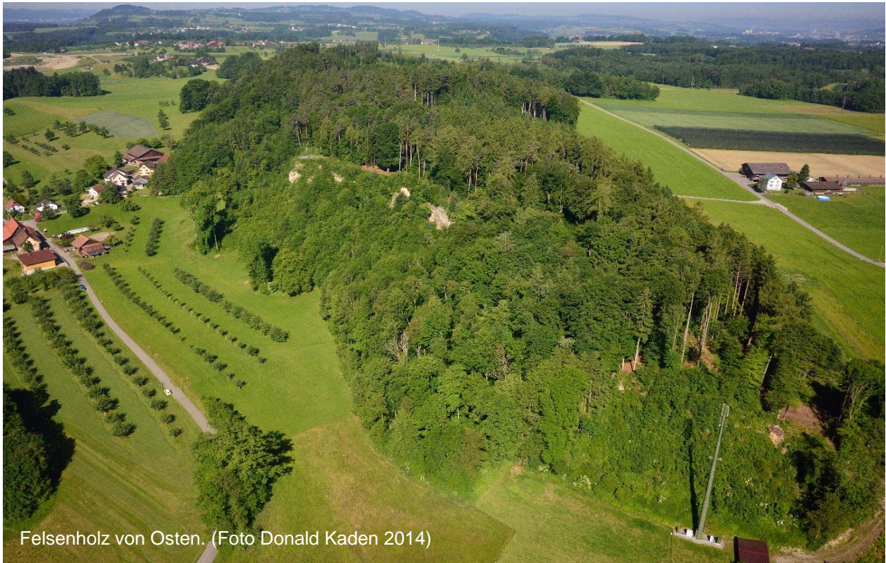
Felsenholz von Osten.