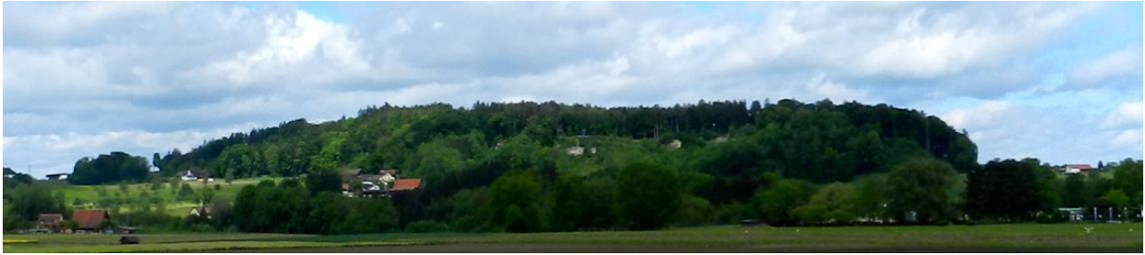
Felsenholz von Südosten. Links in der Mitte: Hummelbärg. Gebäude rechts am Horizont: Feldhof.