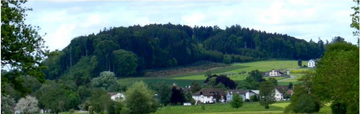
Ostflanke von Osten: Häuserband im Vordergrund: Zihlschlacht. Rechtes Haus oben am Hang: Tannenhof.