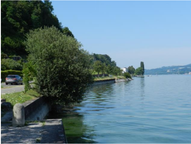
Blick von westlich Berlingen (Wies) Richtung Schweizerland / Nächsthorn.