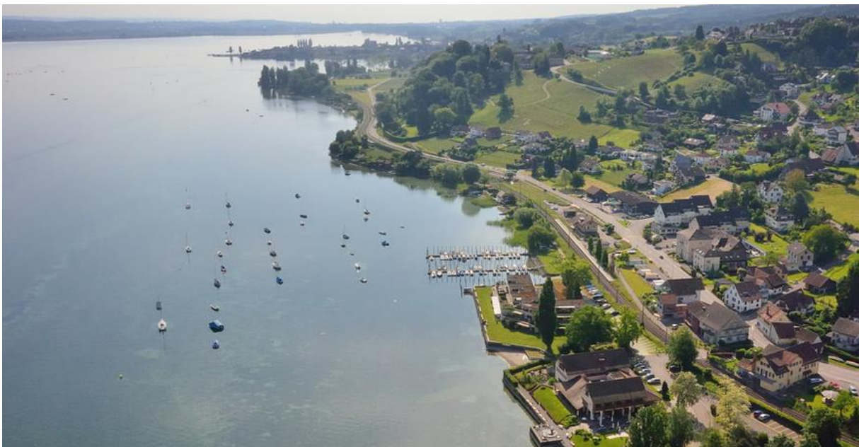
Seeufer östlich Mannenbach Richtung Ermatingen.