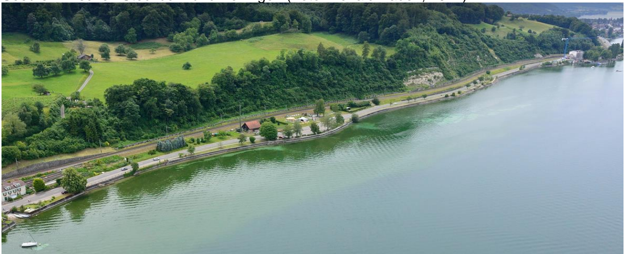
Seeufer westlich Berlingen (Wiis) Richtung Schweizerland / Nächsthorn (Foto Kaden, 2014).