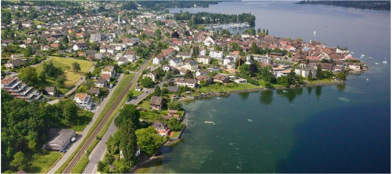
Seeufer östlich Steckborn (Foto: Donald Kaden, 2014).