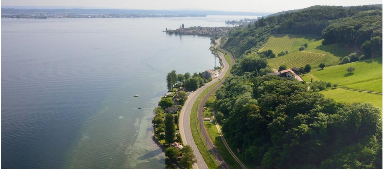
Seeufer zwischen Steckborn und Berlingen (Foto: Donald Kaden, 2014).