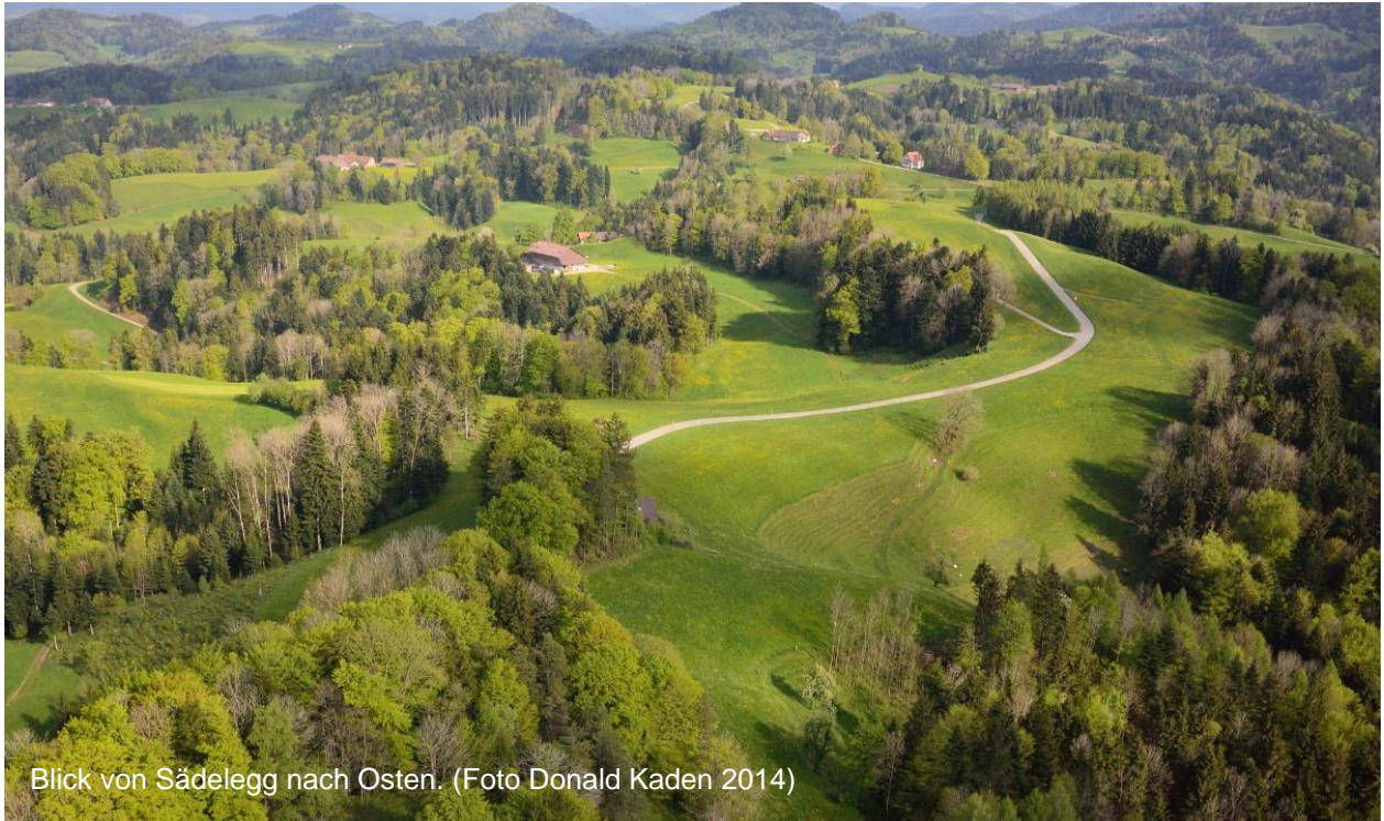
Blick von Sädlegg nach Osten.