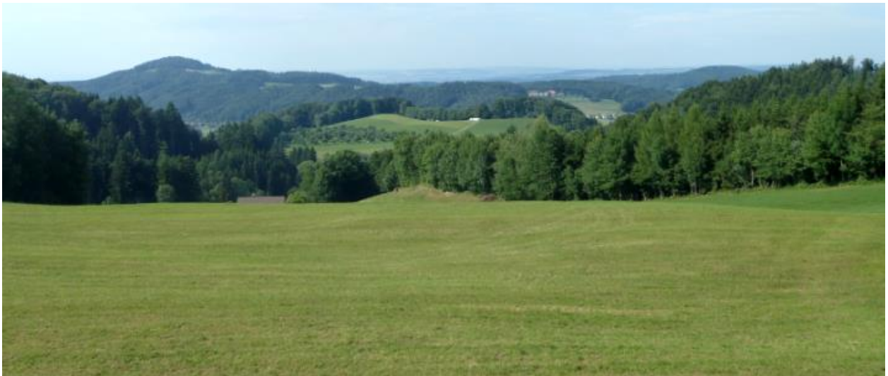
Von südlich Grund Richtung Norden (Tugisholz: Lichtung in der Mitte). Haselberg im Hintergrund.