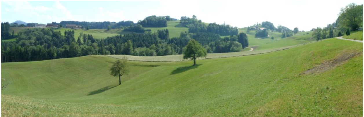
Im nordöstlichen Teil des Tannzapfenlandes: Oberer Speck Richtung Sitzberg: Parklandschaft.