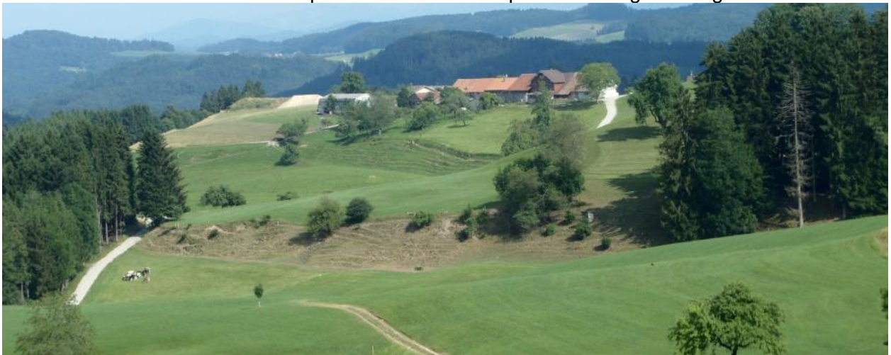
Von westlich Schürli Richtung Speck Weide und Erddepot auf der Kuppe.