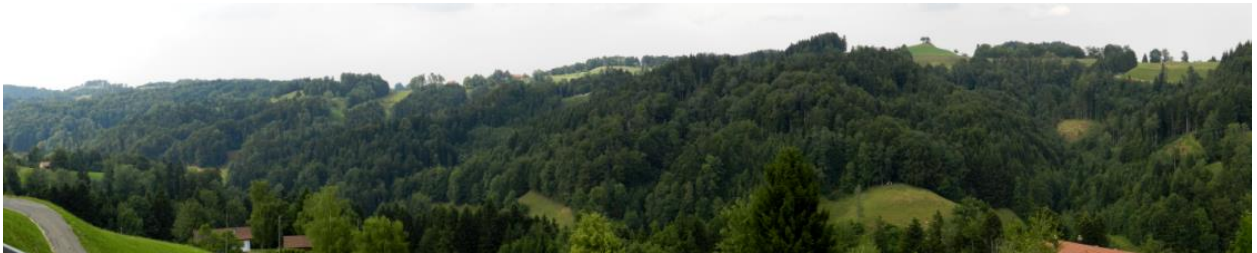
Südabhang von Süden her (von Rossböl, ZH): Wald-Wiesen-Mosaik.