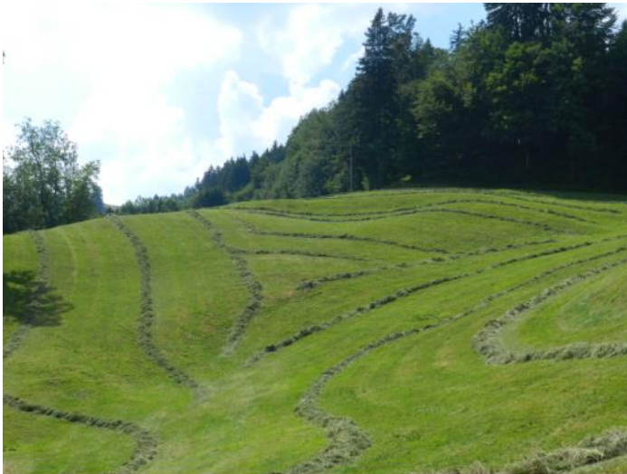
Bewegte Topografie noch verdeutlicht durch Grasmahd (östlich Roopel/Rotbühl).