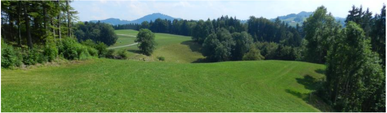
Wiesenlandschaften auf breitem Grat. Von Obersädelegg Blick Richtung Osten.