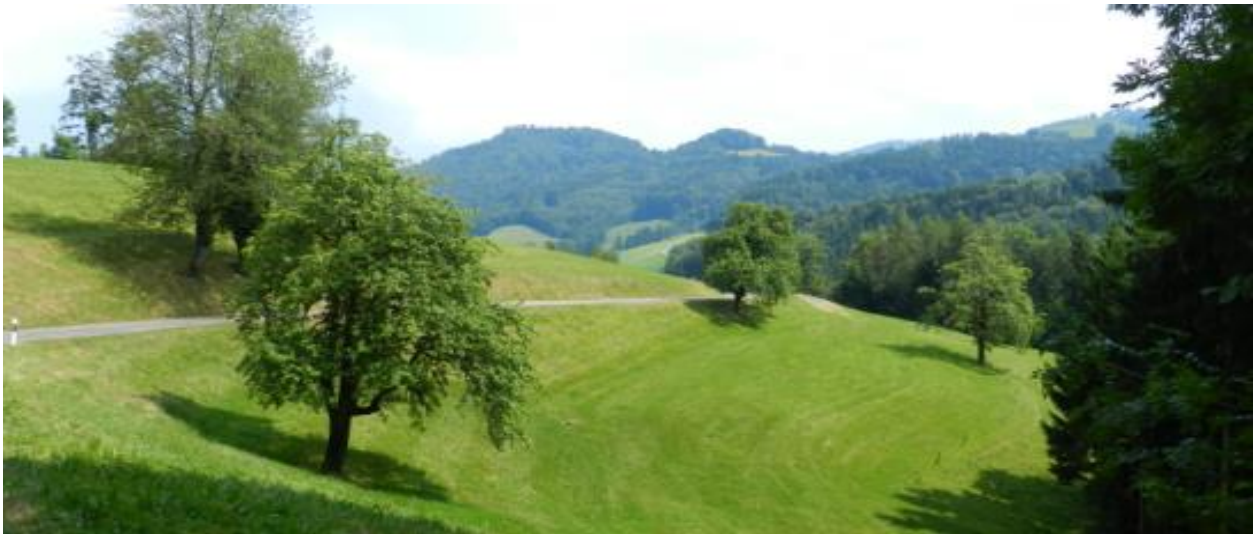
Von östlich Roopel/Rotbühl Richtung Osten.