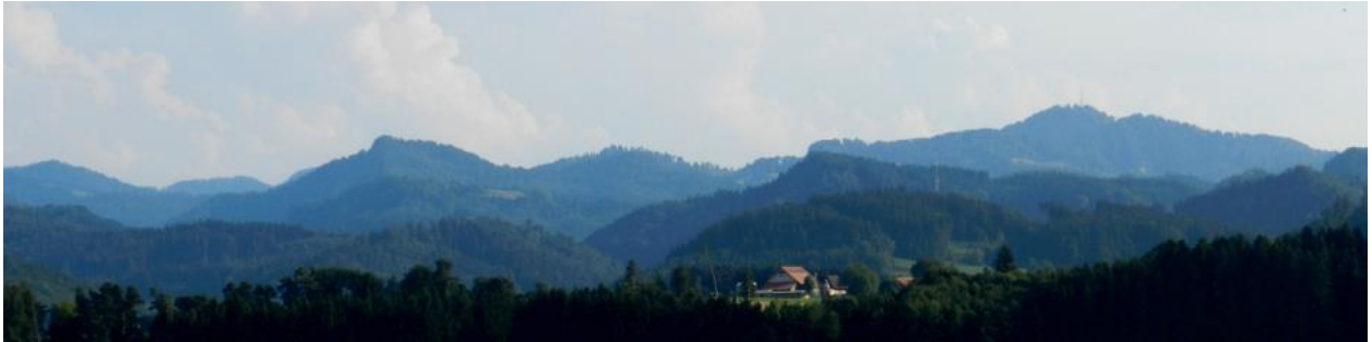
Tannzapfenland im Hintergrund (rechts Hörnli, fotografiert von Eschlikon / Rooseberg).