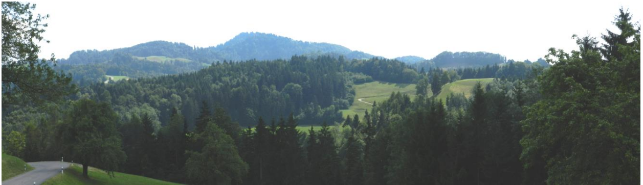
Von östlich Roopel/Rotbühl Richtung Süd-Süd-Ost.