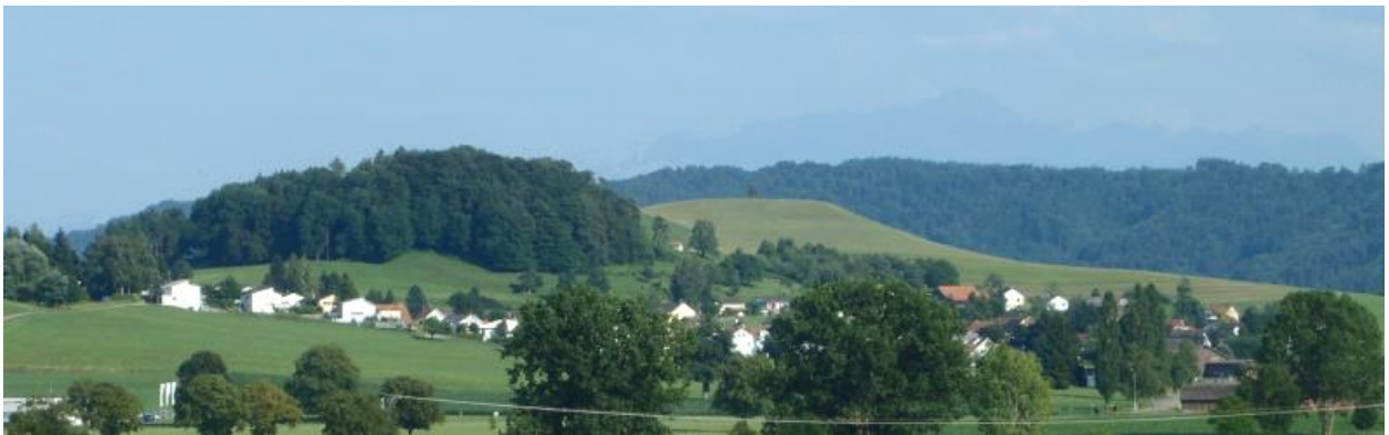
Westansicht (aus dem Süden von Ifwil).