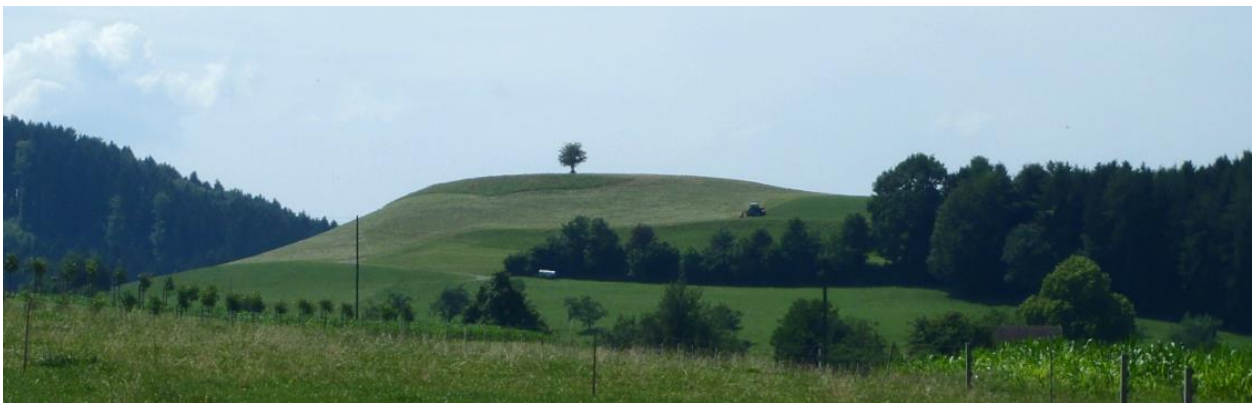
Rundhöcker Stutz von Osten.