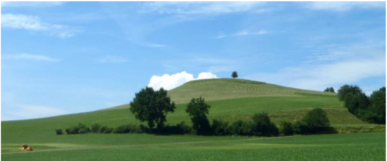
Von Südosten mit reliefunterstützender Hecke am Fuss plus Einzelbaum auf Kuppe.