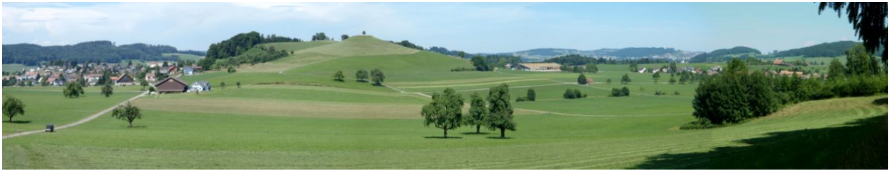
Wallenwil (links) und Rundhöcker Stutz rechts davon. Vorgelagerte offene Landschaft, (Foto aus Süden).