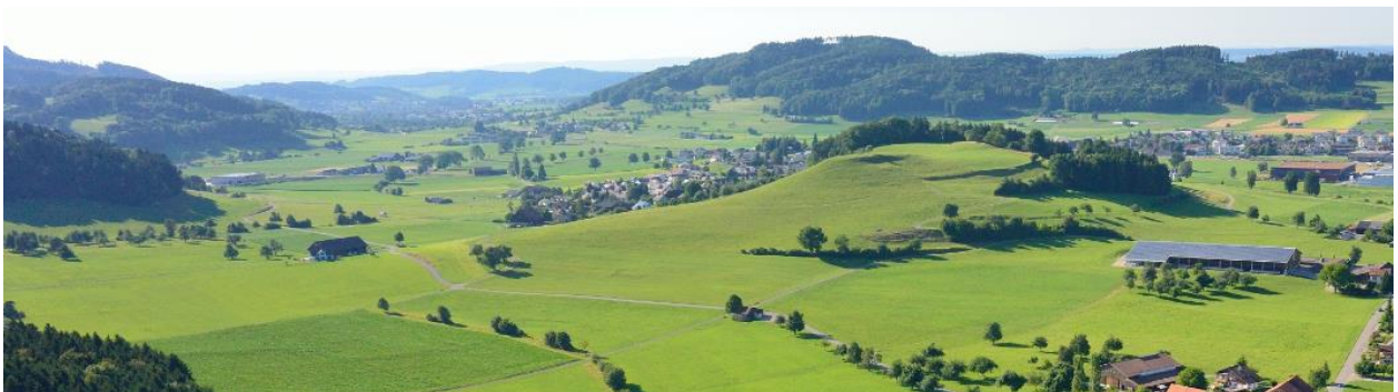
Rundhöcker Stutz von Südosten (Foto Donald Kaden, 2014).