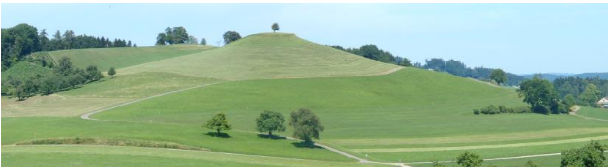
Rundhöcker Stutz von Süden.