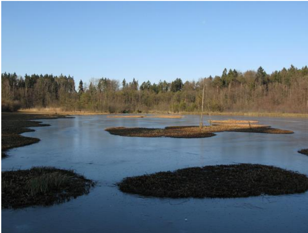
Barchetsee: (Fotoquelle: Alternatives-Wandern.ch).