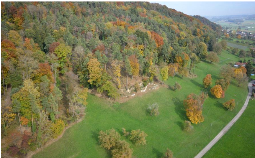
Felsaufschlüsse am Immenberg.