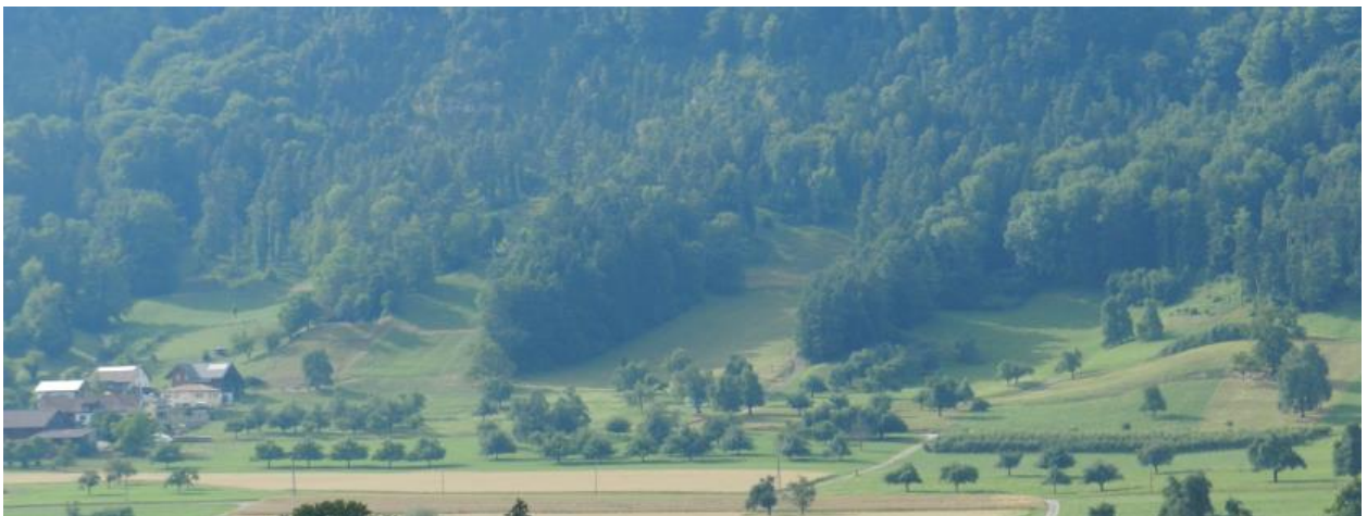
Ausschnitt östlich von Weingarten.