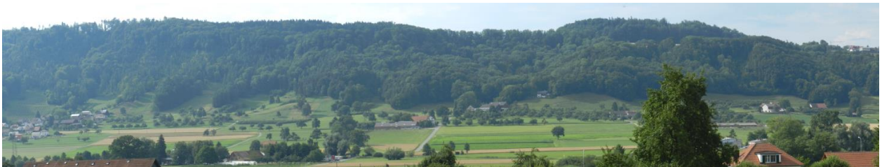
Südostflanke des Immenberges von Nähe Schloss Lommis aus (links: Weingarten).