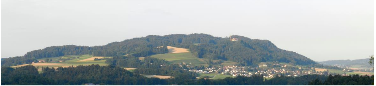
Westflanke des Immenberges von oberhalb Häuselen aus (rechts: Stettfurt).