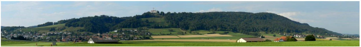
Südflanke des Immenberges von nördlich Sunehof (links: Stettfurt, rechts am Hangfuss: Kalthäuseren).