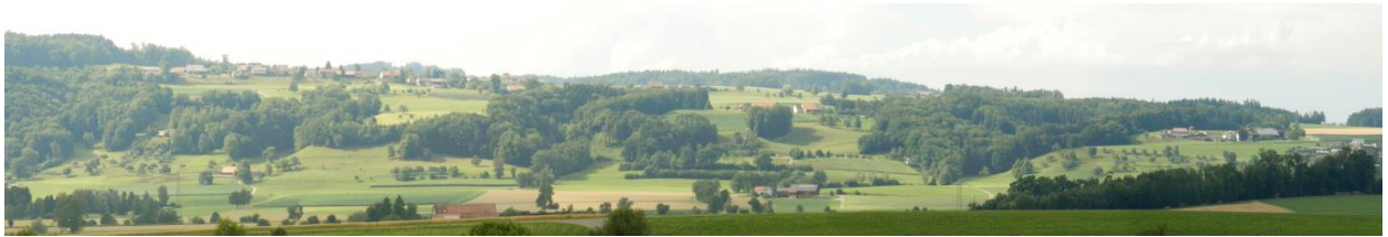
Auslaufende Südostflanke von Isenegg aus. Wetzikon am Horizont. Ganz rechts: Zezikon.