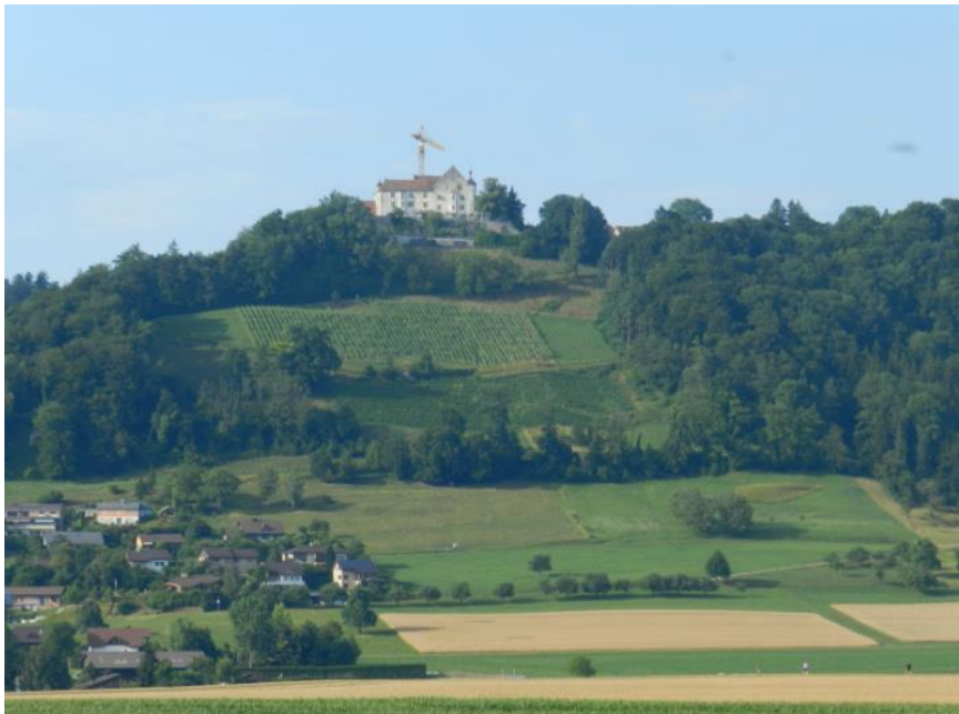
Schloss Sonnenberg ab Sunehof nördlich Wengi.