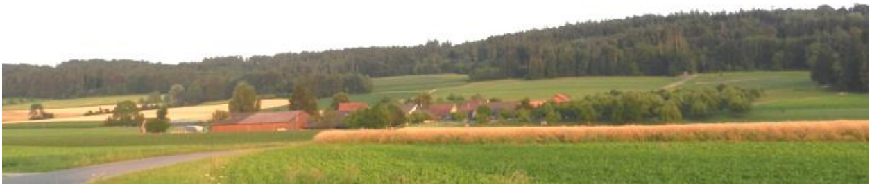
Oberherte von Norden her fotografiert.