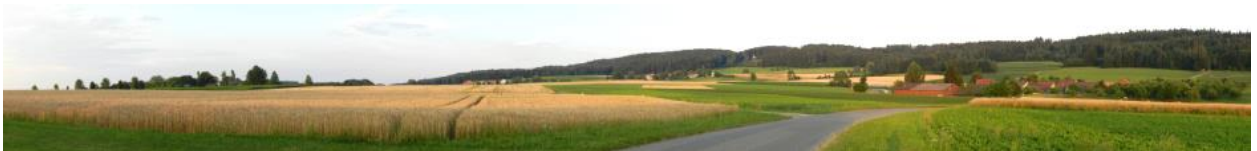
Hochfläche südlich von Argete Richtung Osten (rechts: Oberherte, mittellinks: Rüti).