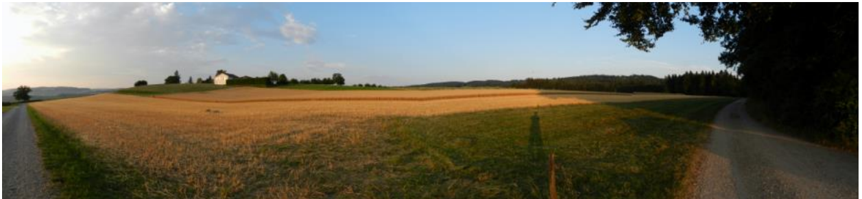
Südwestlich von Ärgete Richtung Osten (Ärgete, Neufeld). Übergang von Hang in Hochfläche (Fototechnische Knickbildung in der Mitte des Bildes).