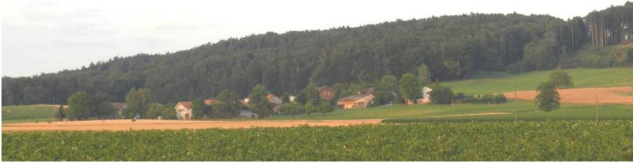
Rüti von Westen her.