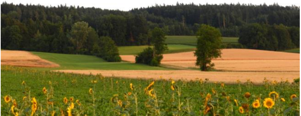
Bachgehölz westlich Rüti.