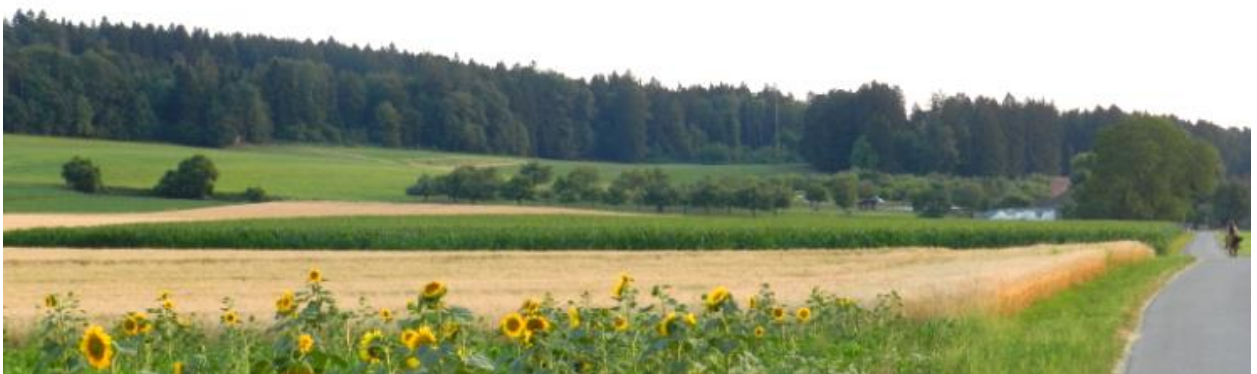
Südbereich von Oberherte (Obstbaum-Garten).