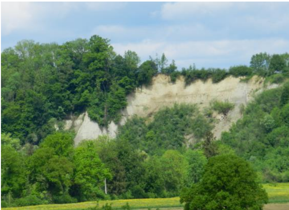
Offene Steilwand, Prallhang der Sitter südlich Obereggi.