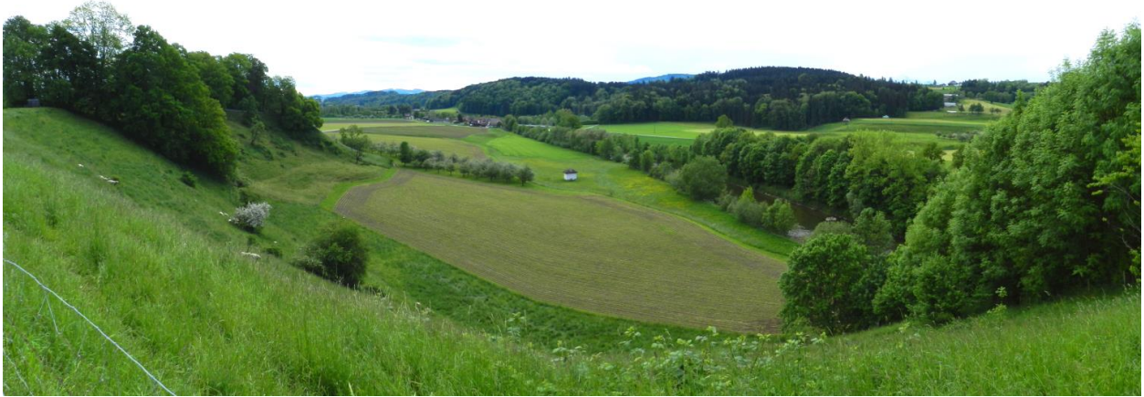
Blick ins Sittertal Richtung Vogelsang und Lütswil von Westen.