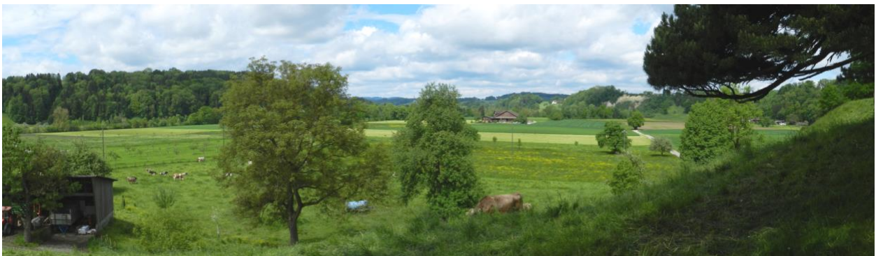
Sittertal-Boden am Fuss des Schloss Blideggs Richtung Neuguet.