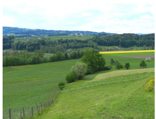
Obstbäume, Hecken, Ufergehölze.