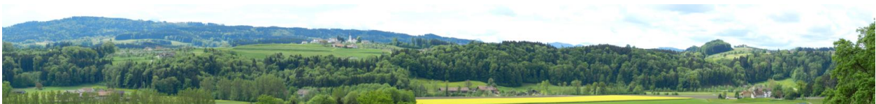
Das Sittertal im Vordergrund. Links hinter erster Baumreihe: Roote, Mitte: Lemisau, rechts: Degenau. (Hintergrund: Siedlung auf Hügel links neben der Bildmitte: St. Pelagiberg).