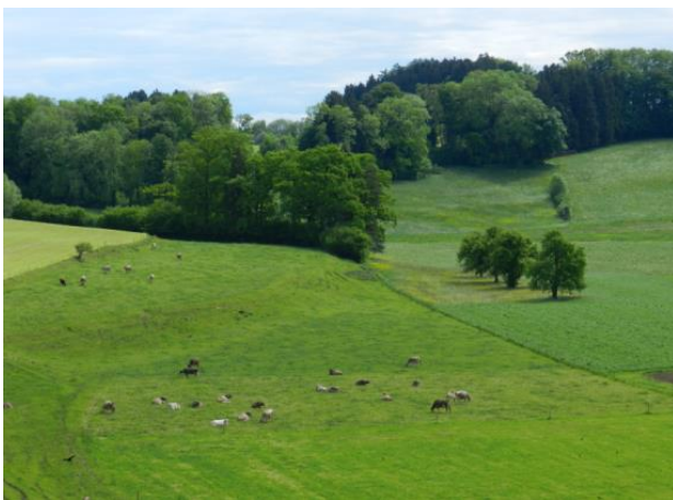
Wiesen, Weiden, Äcker.