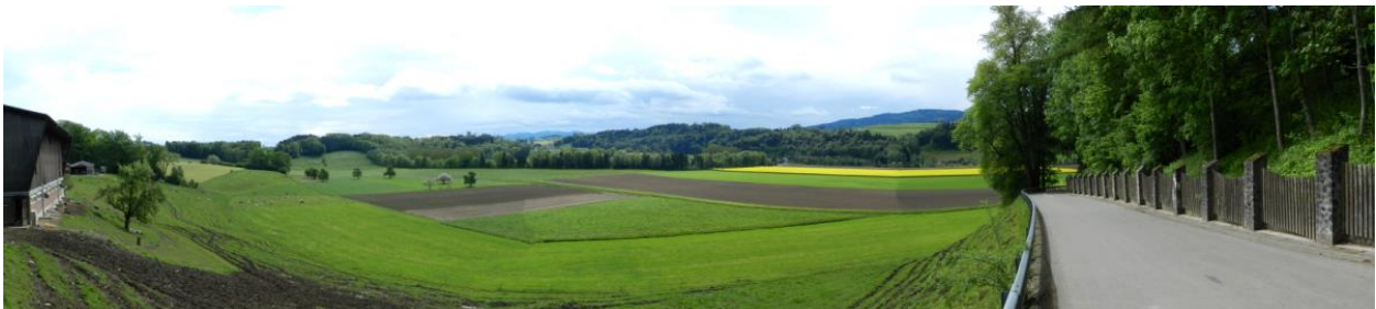
Blick ins Sittertal östlich von Schloss Blidegg.