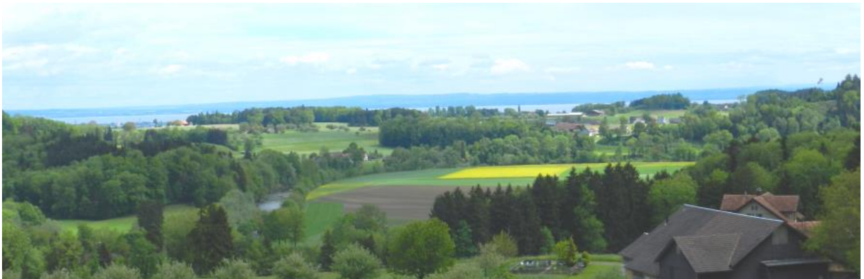
Blick in den Ostteil des Sittertals von nördlich Pelagiberg.