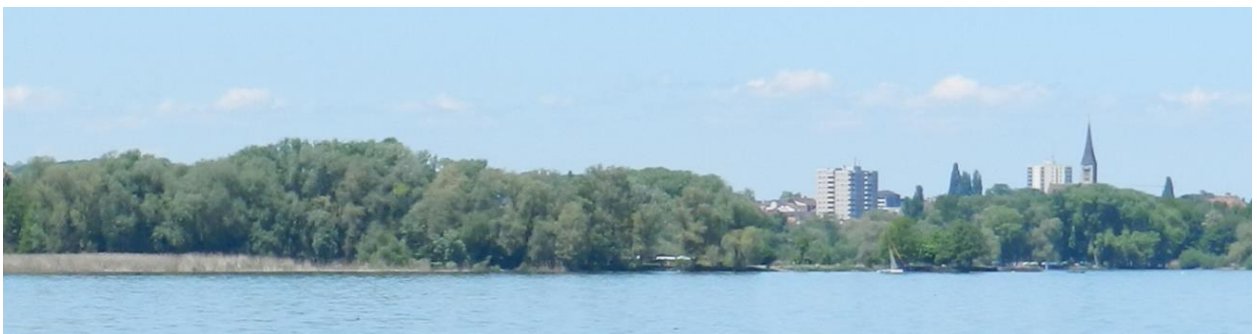
Ausschnitt Seeufer Luxburg von Osten (im Hintergrund rechts Romanshorn).