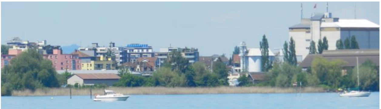
Seeufer vor Romanshorn Ost. (von Widihörnli aus).