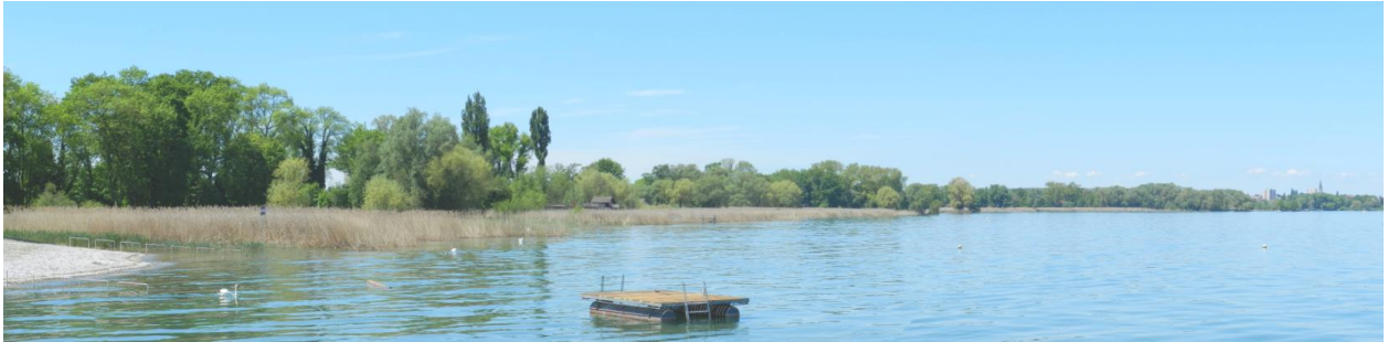
Westlich von Widihorn bis Luxburg.