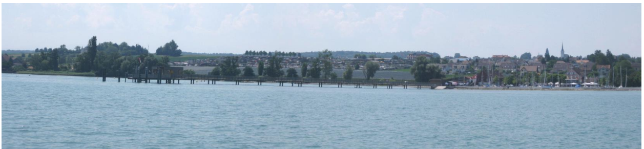
Schiffahrtssteg Altnau, Camping-Bereich im Hintergrund.