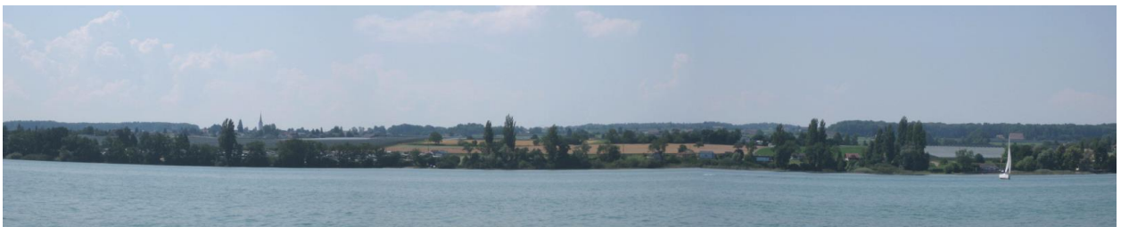
Seeufer zwischen Altnau (ganz links) und Seedorf (ganz rechts), (fototechnisch etwas verzerrt).