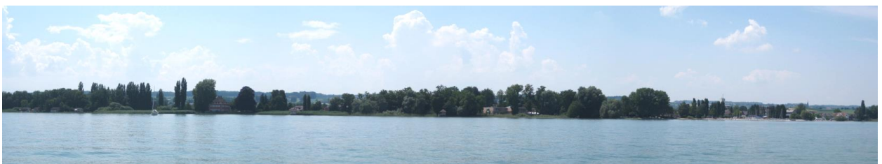
Seeufer östlich Güttingen.