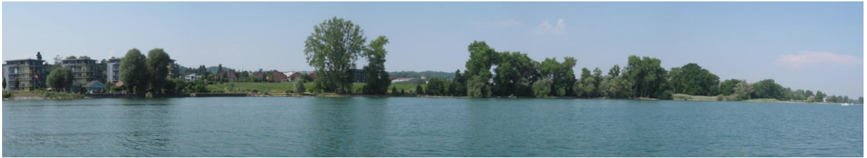
Seeufer zwischen Bottighofen (links) und Kreuzlingen (rechts).