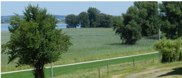
Riedfläche unterhalb Triboltingen.