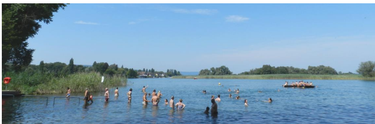
Erholung im Seerhein.