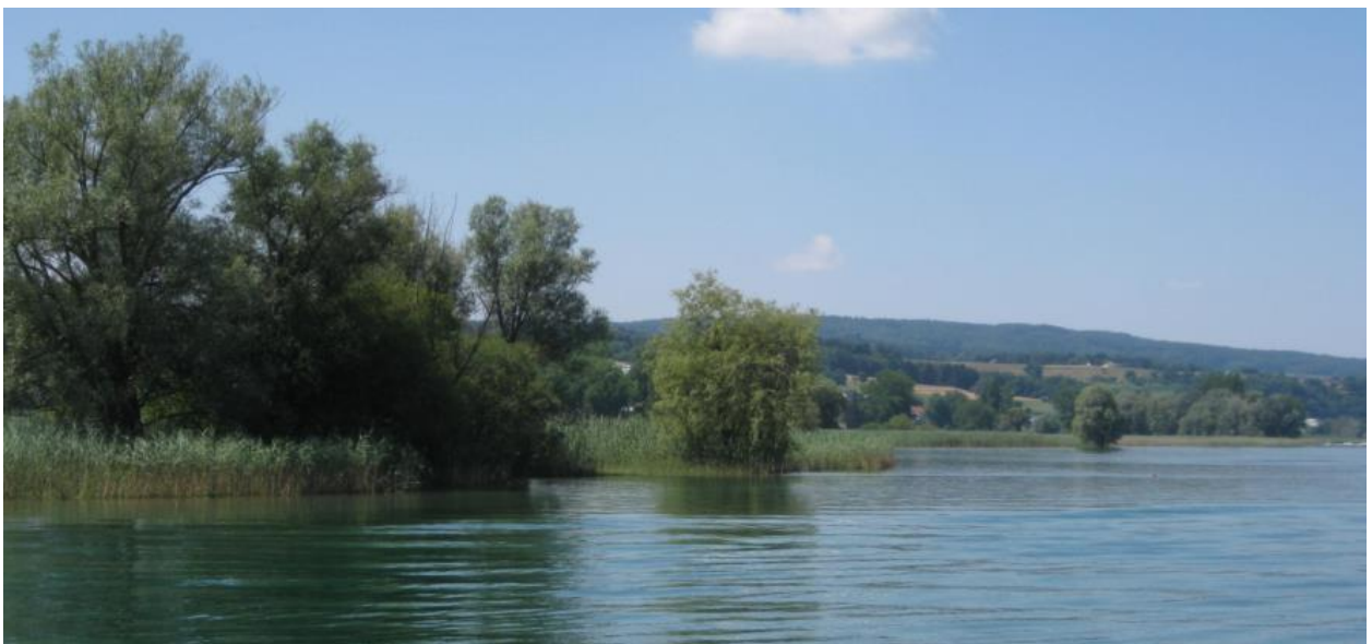
Schilfröhricht westlich Gottlieben.