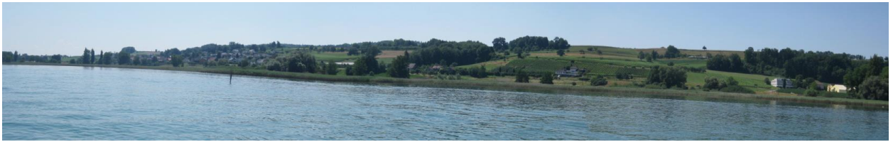
Schilfröhricht östlich von Ermatingen bis Triboltingen (links).