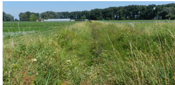
Grabensysteme im Tägermoos.