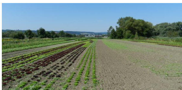
Gemüseulturen im Tägermoos.