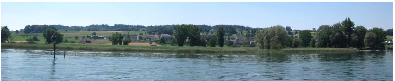
Schilfröhricht vor und östlich von Triboltingen.