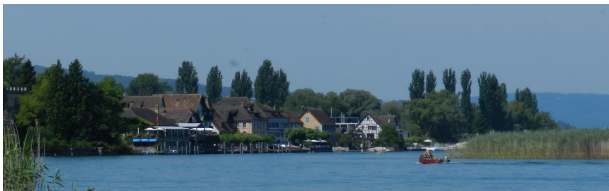
Seerhein mit Gottlieben.