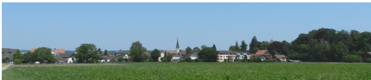
Gottlieben von Süden.