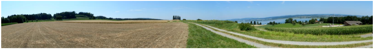
Waldstette südlich Triboltingen.