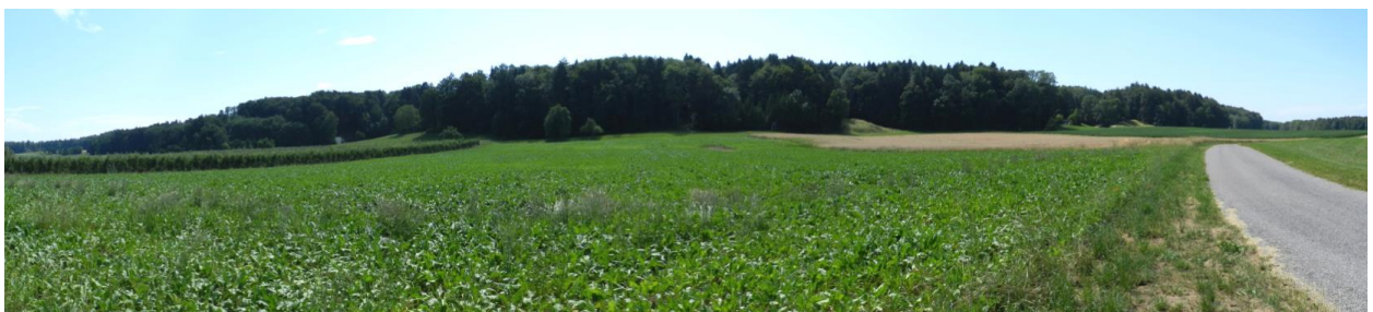
Plateau in Westteil: bei Ober-Fruthwilen.