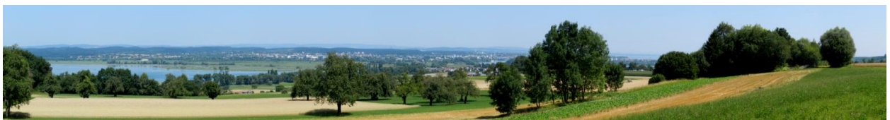
Sunebärg westlich Tägerwilen.