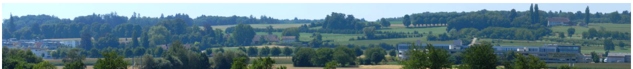
Ostteil von südlich Kreuzlingen bis Nagelshuuse (von Tägermoos aus).