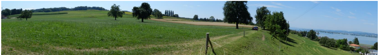
Terrassenkante südlich Triboltingen (Bereich Sunebärg).