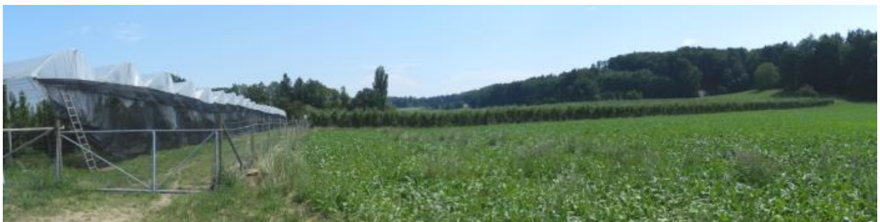
Plateau in Westteil: Chriesiland bei Ober-Fruthwilen.