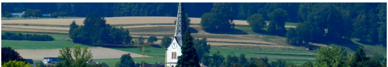
Ackerterrassenflur Forebüel westlich von Studenhof oberhalb Tägerwilen (von Tägermoos aus).