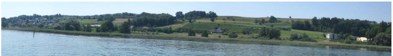
Mittelteil: Triboltingen bis Ermatingen.