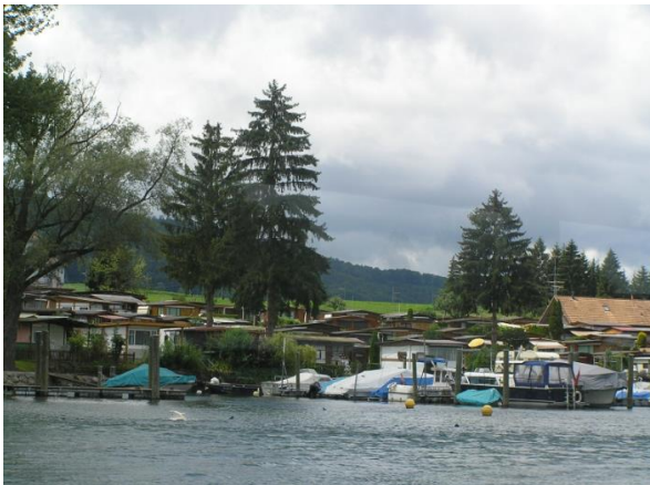
Camping westlich Wagenhausen (2007).