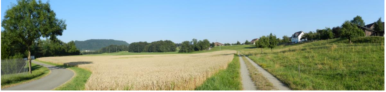
Östlich von Rheinklingen. Links mit Ufergehölzen, davorliegenden Ackerflächen und rechts deutlich erkennbare Fluss-Terrassenkante.