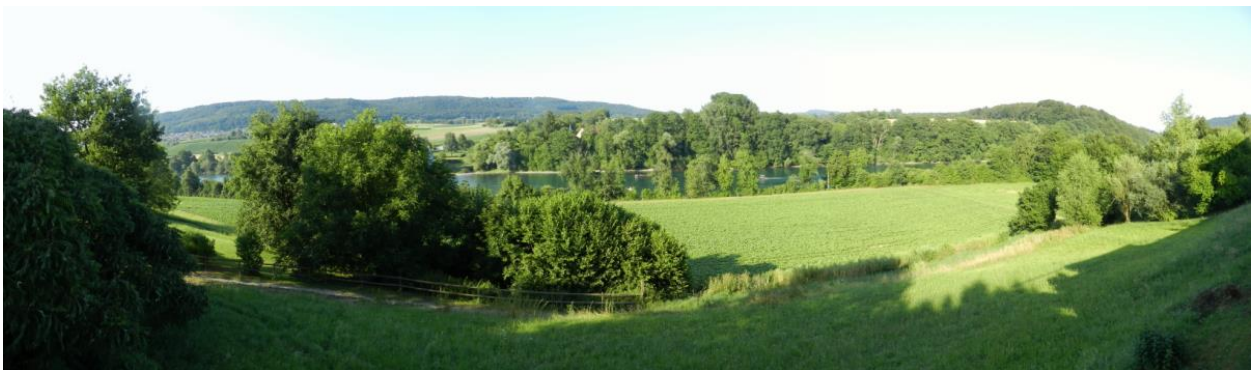
Östlich von Diessenhofen mit Rhein, Uferbestockung, davor liegenden Äckern und im Vordergrund sichtbaren Gehölzgruppen an der Fluss-Terrassenkante.