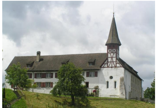
Probstei Wagenhausen vom Rhein aus (2007).