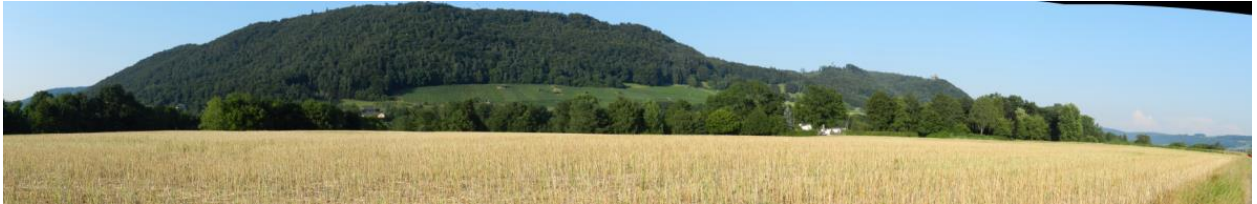
Bereich Säling mit Ackerbaufläche vor Rheinufergehölz (Hintergrund: Wolkensteinerberg).