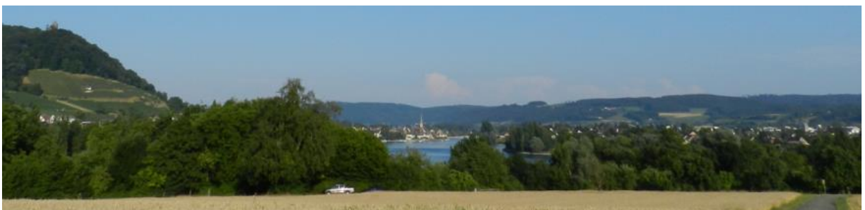
Sicht von westlich Wagenhausen nach Stein am Rhein / Wagenhausen.