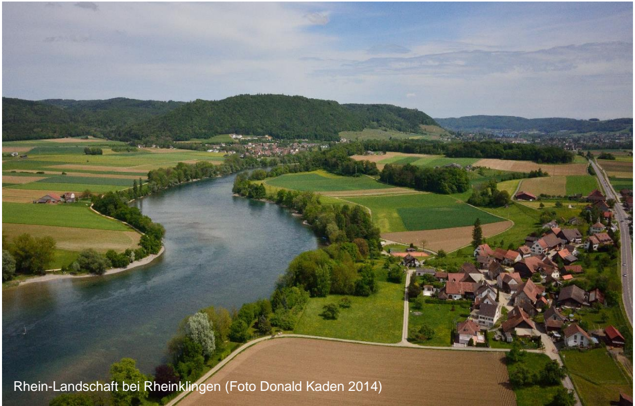
Rhein-Landschaft bei Rheinklingen