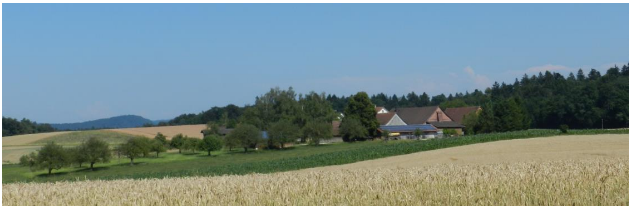
Weiler Dickihof aus Richtung Westen mit nordwestlich angrenzendem Obstgarten.