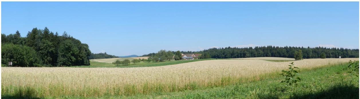
Blick von Westen aus der Waldlichtung Richtung Weiler Dickihof.