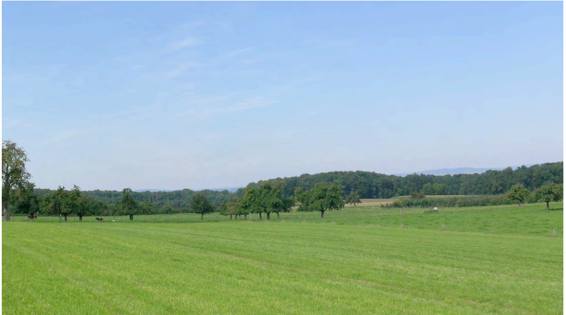
Schnittwiese und Hochstammobstbäume in der Gemeinde Langrackenbach, Archiv SL, 09/10