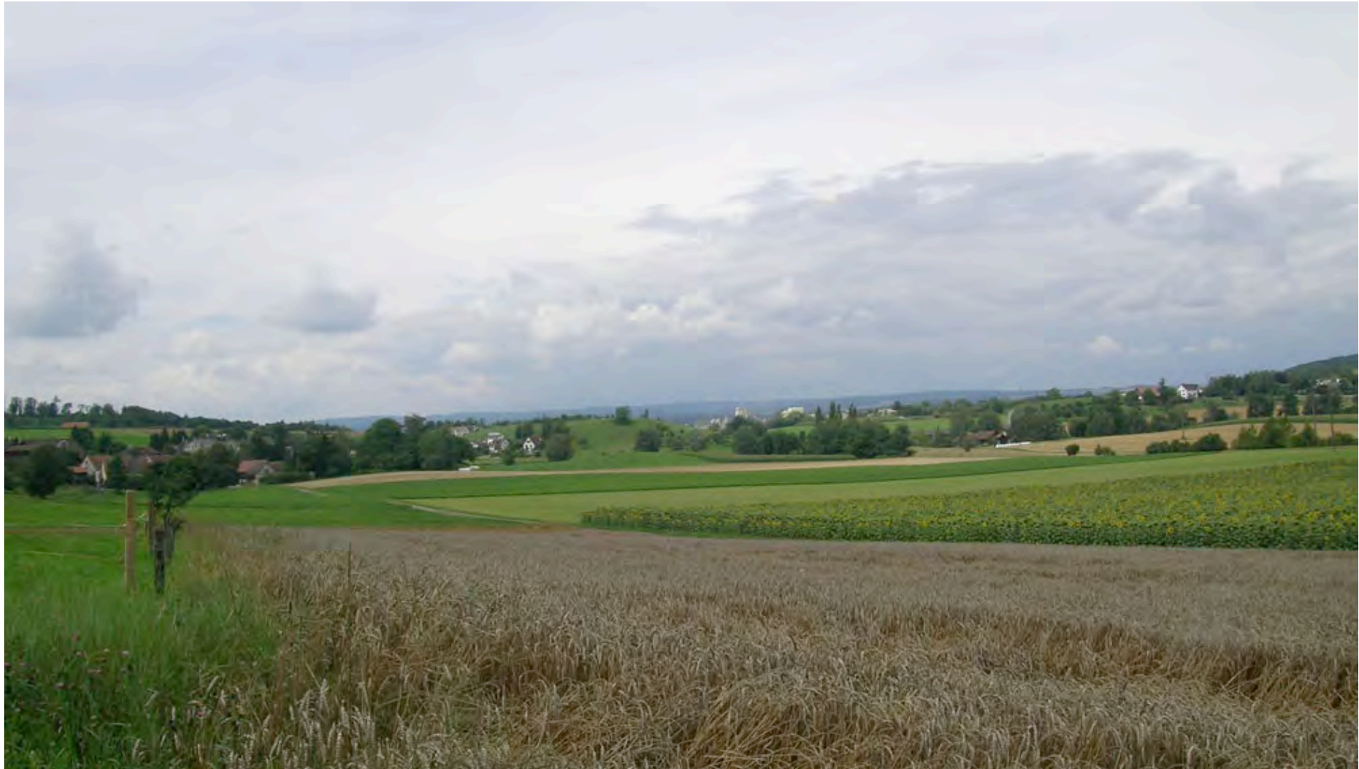
Blick über die Gemeinde Diessenhofen, links im Bild Willisdorf, Archiv SL, 08/10