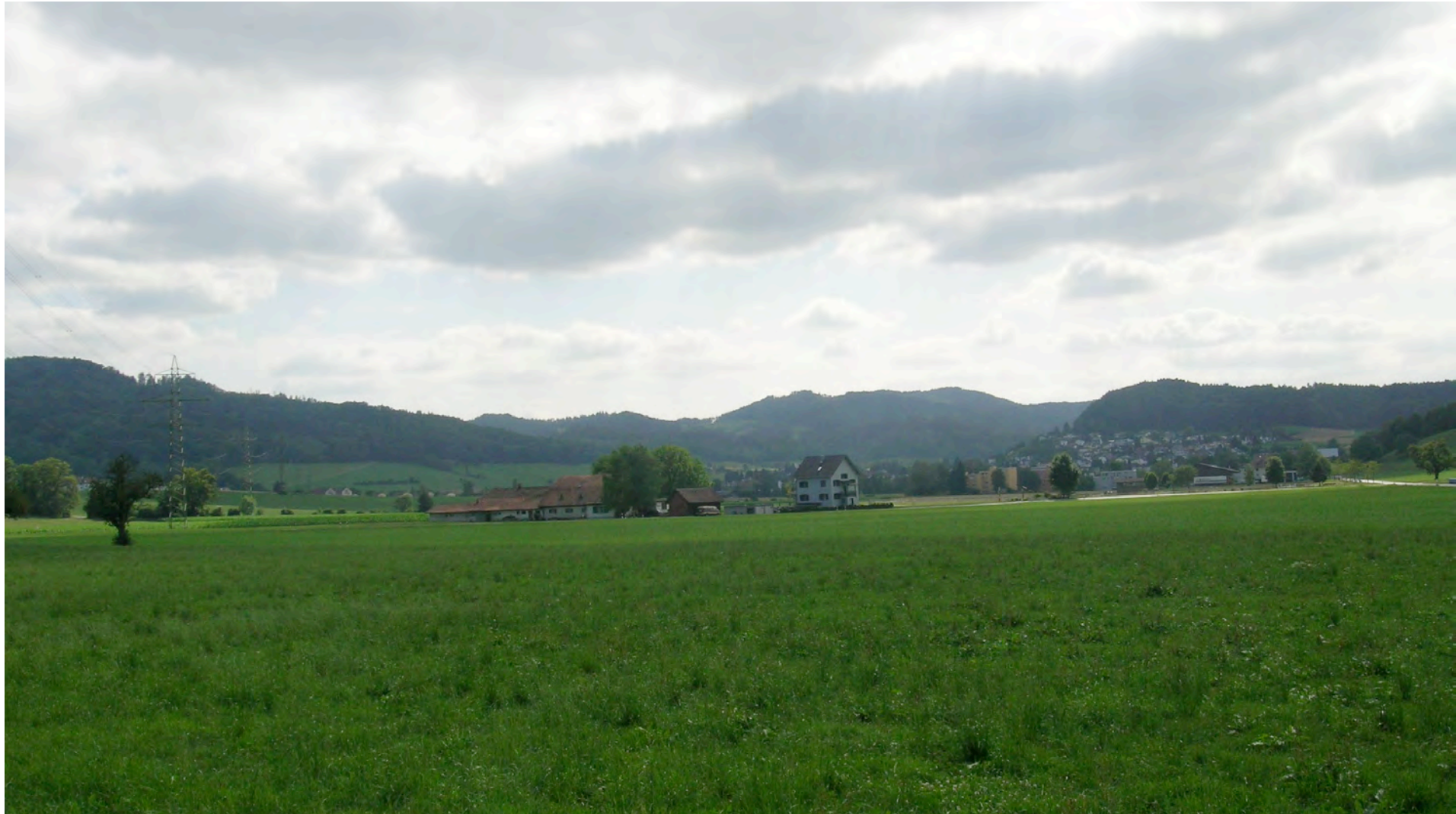
Links im Bild der Haselbärg, rechts Ettenhausen mit dem Berg Eich, Archiv SL, 07/10