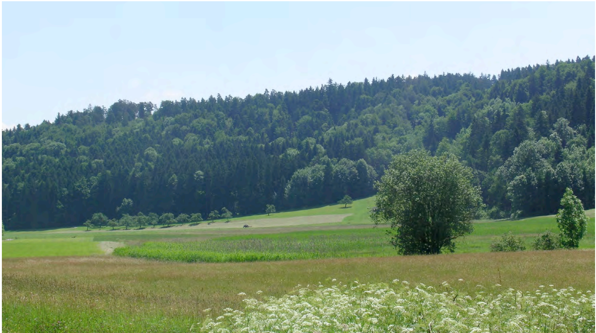
„Ägelsee“, ein Flachmoor und Amphibienlaichgebiet von nationaler Bedeutung, mit dem angrenzenden Wald Ägelseehalden, Archiv SL, 06/10