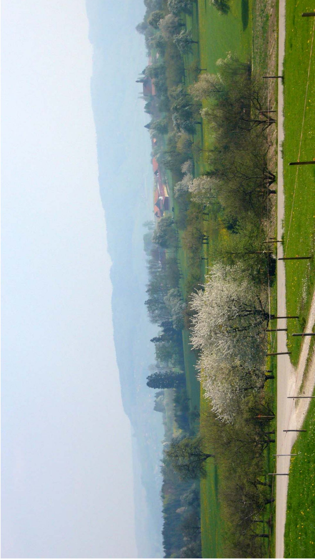
Ausblick von Woffikon nach Osten über das Gemeindegebiet von Amlikon-Bissegg, Archiv SL, 04/09