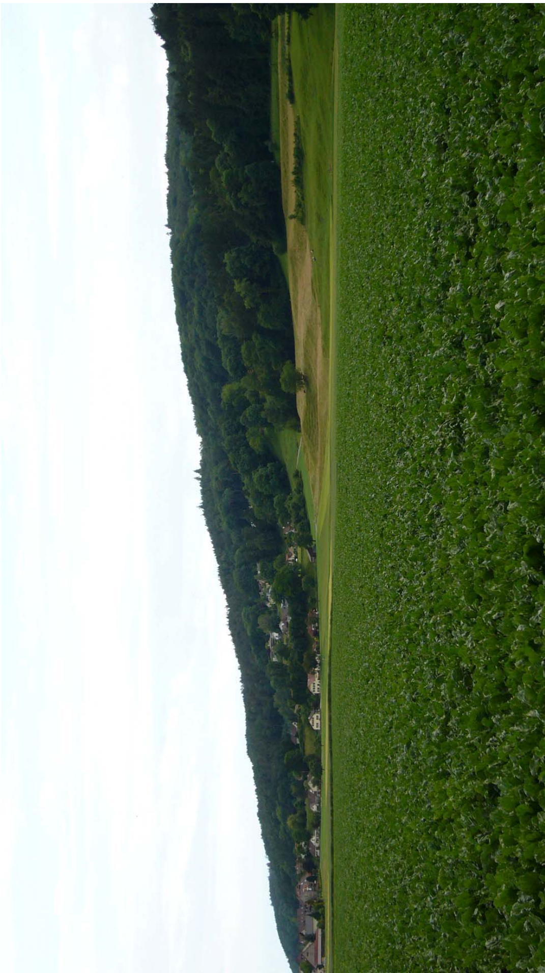
Übergang des Wellenberg-Abhanges in die Thurebene, wo eingangs Wellhausen ehemalige Ackerterrassen ausgebildet sind, Archiv SL, 06/09