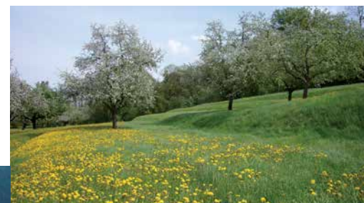
Terrassenflur bei Märstetten

Die Mehrheit der Terrassenstandorte im Kanton Thurgau wird hauptsächlich als Wies- oder Weideland genutzt. Im Wiesland sind die Terrassenböschungen meist gut erhalten, gefährdet werden sie hier vor allem durch den Einsatz von Maschinen. Die Beweidung wirkt sich bei hoher Intensität negativ auf den Erhaltungsgrad der Terrassen aus.