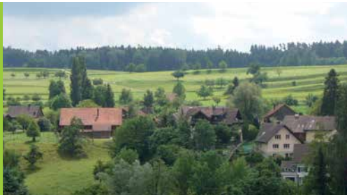
Terrassenfluren bei Buhwil und Riedt (Schlüsselgebiete 4 und 5)

Der Inventarisierung folgt also ein Umsetzungsprozess, welcher mit dem Aufzeigen des Handlungsbedarfs im Inventar in Gang gesetzt wurde. Der Umsetzungsprozess kann durch die Gemeinden sehr unterschiedlich gestaltet werden. Es bestehen zahlreiche Möglichkeiten, die neben dem normativen Schutz und der planerischen Sicherung, von Bewirtschaftungslenkung bis zu Unterhaltsförderung reichen können.