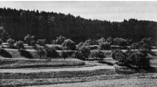
Ackerterrassen bei Wellhausen um 1960...

Die Stiftung Landschaftsschutz Schweiz erarbeitete in den Jahren 2009 und 2010 im Auftrag der Abteilung Natur und Landschaft des Amtes für Raumplanung ein Inventar der Ackerterrassen für den gesamten Kanton Thurgau. Ziel der Inventararbeiten war es, eine Übersicht über die Ackerterrassen im Kanton zu gewinnen und den Erhaltungsgrad, die Qualität der Ackerterrassen sowie den Handlungsbedarf zu beschreiben. Damit konnte ein Arbeitsinstrument für die Raumplanung geschaffen werden, welches auch dazu beitragen kann, dass die vielerorts in Vergessenheit geratenen Ackerterrassen wieder ins Bewusstsein der Bevölkerung geraten.